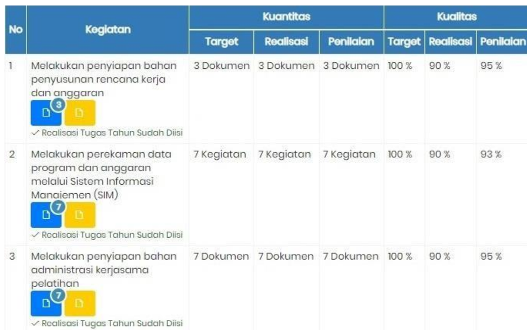
Gambar 3 Penilaian Kinerja pada Aplikasi E-Personal